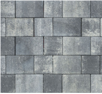
Bautzner Pflaster weißschwarz 8 cm Verlegung im Reihenverband