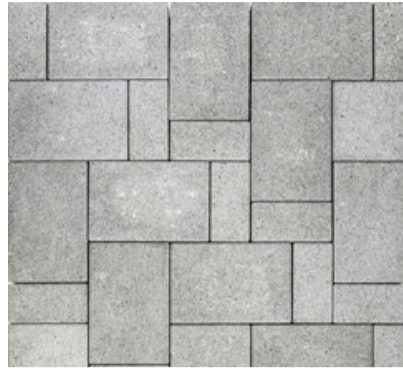
Bautzner Pflaster Koralle grau 8 cm Verlegung im Fischgrätverband