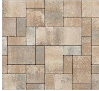
Bautzner Pflaster mediterrano 8 cm Verlegung im wilden Verband