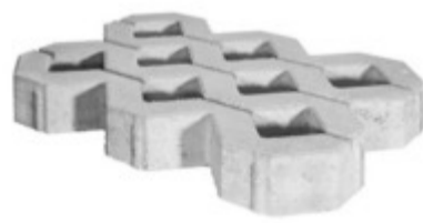
Rasengitterstein 60 x 40 x 8