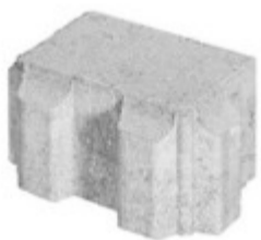
Rasenverbundstein 12 x 16 x 8