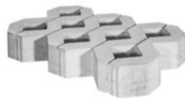
Rasengitterstein 60 x 40 x 10