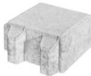
Rasenpflasterstein 20 x 20 x 10