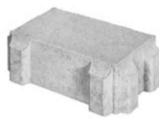
Rasenverbundstein 24 x 16 x 8