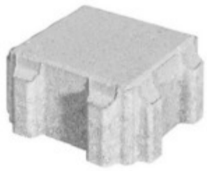
Rasenpflasterstein 17 x 17 x 8